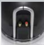
低損失プッシュターミナル