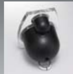
低共振エンクロージャー

そのクリアフレームに映るのは、 あなたの感性と、澄みきったリアルサウンドへの憧れ。