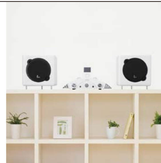
CUBE-S & PA40Ti (White)

優れたデザインは、美しさと機能が両立されることで成り立ちます。ユーザーを魅了し、いつまでも愛され続けるプロダクトデザインには、必ずその2つの価値が宿っているのです。